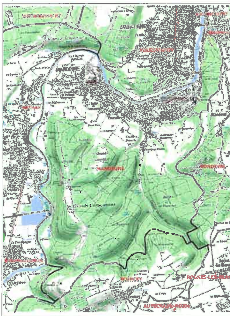
Localisation de la commune de Mandeuve - IGN/Secteur d'étude élargi aux communes avoisinantes Données DREAL Bourgogne Franche Comté/ IGN SCAN 25

La commune est soumise à divers types d'aléas et/ou de risques naturels et technologiques : risque de transport de matière dangereuse : ouvrage de transport de gaz Haute Pression (Mathay – Pont de Roide), risque de rupture du barrage de Châtelot, risque sismique modéré (3), risques mouvements de terrain (karst, glissement de terrains, éboulements), aléa remontées de nappes, aléa retrait et gonflement d'argiles, risque inondation par débordement du Doubs ou par ruissellement. À ce titre, la commune est concernée par le Plan de Prévention du Risque Inondation (PPRI) du Doubs et de l'Allan, arrêté le 27 mai 2005, et est incluse au sein du Territoire à Risque Important d'Inondation (TRI) de Belfort - Montbéliard, arrêté le 12 décembre 2012.